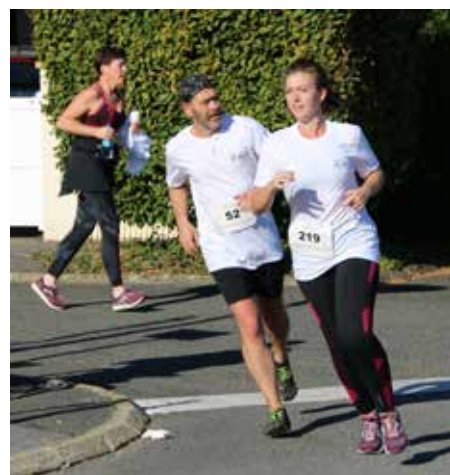
Dans les rues servonnaises