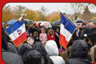
■ Cérémonie du 11 novembre