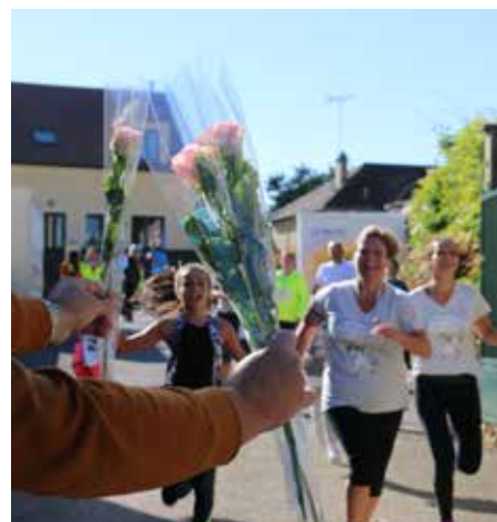
Arrivée en beauté !