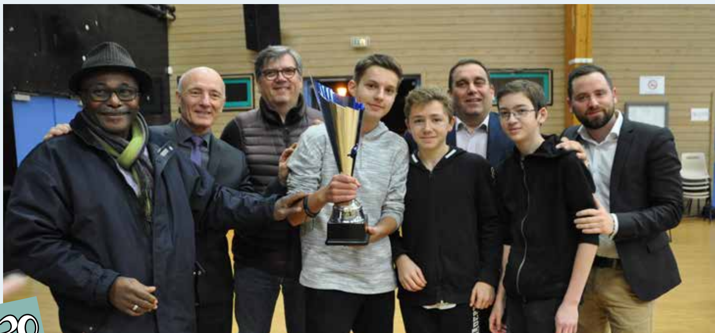
L'équipe gagnante et les élus de la communauté de communes