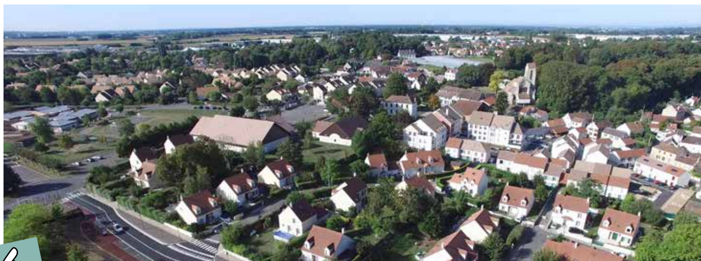
Vue aérienne de Servon

Monsieur le Maire donne lecture des décisions prises par délégation du conseil municipal.