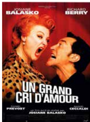
L'affiche originale du film

L'équipe de choc de la troupe du petit théâtre de Grisy vous proposait le samedi 13 octobre la pièce adaptée du film de Balasko «Un grand cri d'amour». Gigi et Hugo, acteurs sur le déclin, se retrouvent pour jouer ensemble une nouvelle pièce «d'amour». Ils se sont connus dans le passé et aimés passionnément ; aujourd'hui, ils se haïssent. Mais pour que la pièce voie le jour et qu'ils puissent gagner leur vie, ils acceptent le pari. Des retrouvailles explosives salle Roger Coudert.