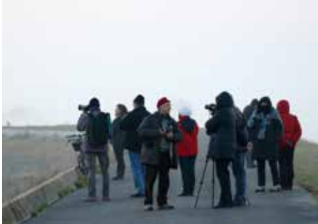
PHOTO CLUB SERVON77 permet à ses adhérents de bénéficier de quelques heures supplémentaires de pédagogie le samedi en plus de nos sorties mensuelles. Pour exemple, nous avons déjà traité l'initiation à l'analyse de photos, le post-traitement sur ordinateur puis l'approche «studio». Nous reprendrons ces thèmes périodiquement ainsi que d'autres.

La dernière sortie au lac du Der a été un enchantement de paysages au crépuscule et dès l'aurore envahis de grues cendrées.