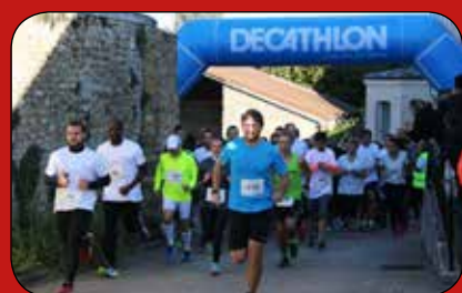
■ Course solidaire