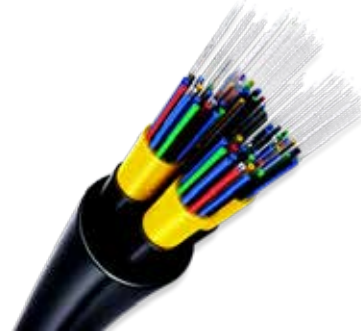
Vue en 3D d'un câble de fibre optique

Le développement de la fibre va de pair avec l'évolution des usages et des besoins croissants des individus (particuliers et entreprises). La fibre optique est la technologie la plus récente en matière d'accès à Internet. En pratique, elle permet le transfert des données à grande vitesse via la lumière. Cette dernière transite par un câble contenant des fils de verre ou de plastique aussi fins que des cheveux.