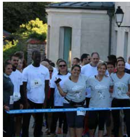
Sur la ligne de départ