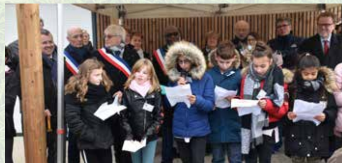
▲ Les élus du CMJ