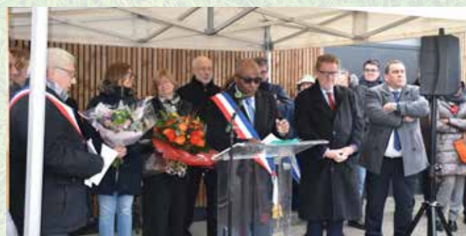
Prises de parole ▲