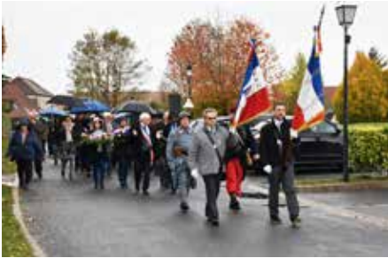
Le cortège emmené par les portes drapeau de la FNACA

Dimanche 11 novembre 2018 à 11h, la cloche de l'église Saint-Louis / Sainte Colombe a sonné à pleine volée pour célébrer le centième anniversaire de l'armistice de la première guerre mondiale et honorer la paix.