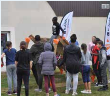
▲ Parcours d'obstacles ▶

Le 31 octobre les jeunes de Servon, Chevry-Cossigny et Brie-Comte-Robert se sont réunis à Servon pour une après-midi « Mud Day » en extérieur (un parcours du combattant avec différents obstacles). A l'intérieur, les animateurs proposaient des ateliers sportifs avec notamment un baby foot gonflable géant, des énigmes... Après ces moments intenses, les jeunes sont partis déguisés chercher des bonbons auprès des habitants de Servon. Les ados ont fini leur journée autour d'une pizza (bien méritée) et d'une soirée dansante en salle des colonnes. Une journée intercommunale encore réussie qui a eu beaucoup de succès.