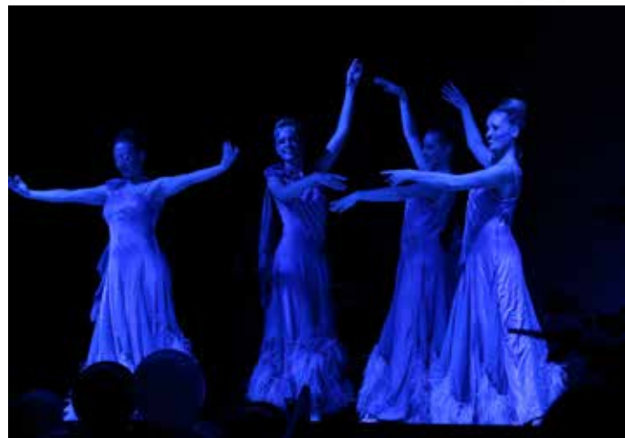
Les danseuses de la troupe Nevada

Au programme des tubes «Made in France» grâce au talent des artistes chanteurs et danseurs qui ont proposé des tableaux festifs et colorés. Les gourmands n'étaient pas en reste grâce au traiteur «L'escale gourmande» de Guignes qui proposait un repas de fête : torsade de sole farcie aux petits légumes et coulis de homard en entrée, suivie d'un pavé de boeuf sauce foie gras sur purée de vitelottes et haricots verts et enfin mille feuilles revisité au caramel. La journée s'est achevée sur quelques pas de danse.