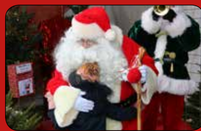
■ Marché de Noël