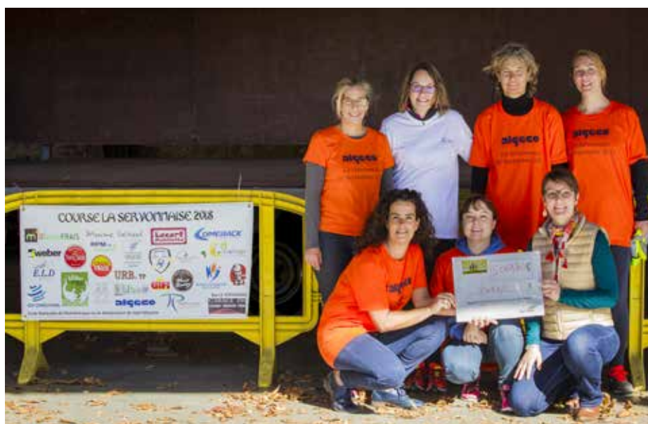
5061€80 au profit du SESSAD, Merci